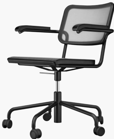
S 64 NDR NETZGEWEBE 2, SCHWARZ MESH 2, BLACK