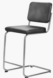
S 32 PVHT VOLL UMPOLSTERT FULL UPHOLSTERY