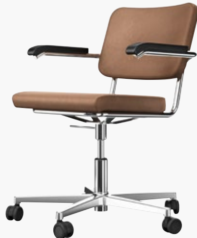
S 64 PVDR VOLL UMPOLSTERT FULL UPHOLSTERY