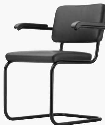
S 64 PV VOLL UMPOLSTERT FULL UPHOLSTERY