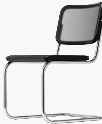
S 32 N NETZGEWEBE 2, SCHWARZ SYNTHETIC MESH 2, BLACK